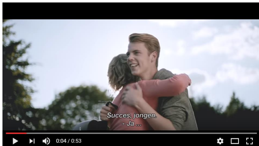
Een grappig filmpje informeert jongeren over de nieuwe rijopleiding

Om jongeren en hun begeleiders te informeren over de vernieuwde rijopleiding start de VSV met een campagne, onder meer met een grappig filmpje op sociale media en een folder die via rij scholen, examencentra en gemeentebesturen wordt verdeeld.